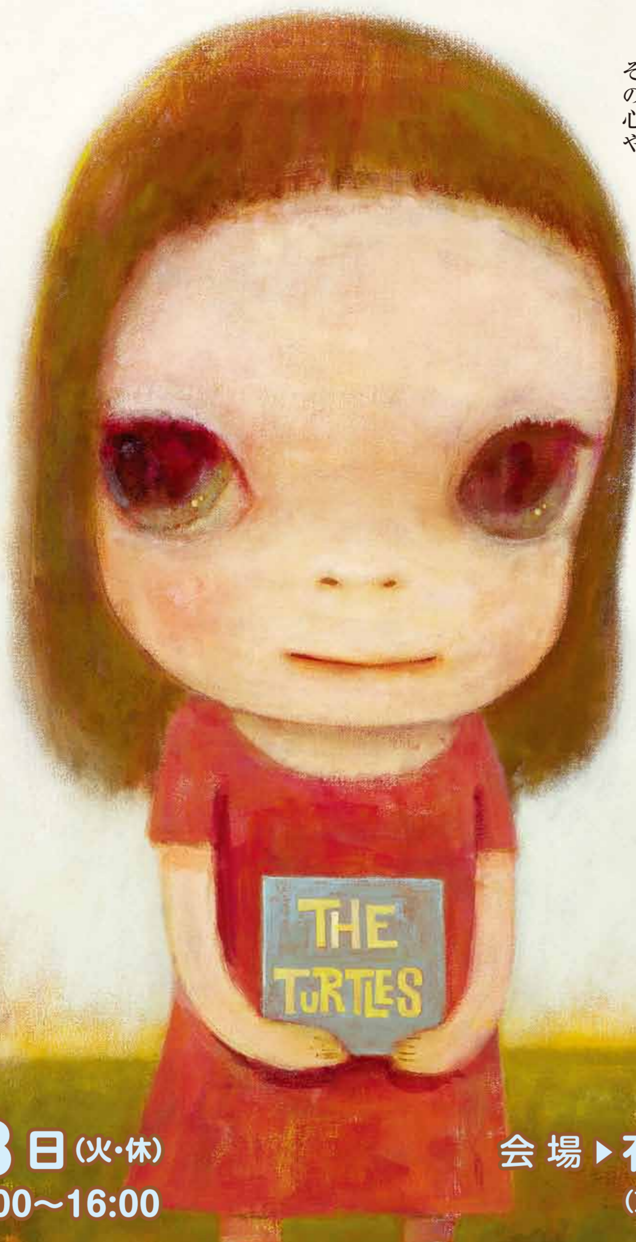
奈良美智「Eve of Destruction」2006 原美術館所蔵 ©Yoshitomo Nara

戦死やあわれ 兵隊の死ぬるやあわれ 遠い他国で ひよんと死ぬるや だまつて だれもいないところで ひよんと死ぬるや ふるさとの風や こいびとの眼や ひよんと消ゆるや 国のため 大君のため 死んでしまふや その心や