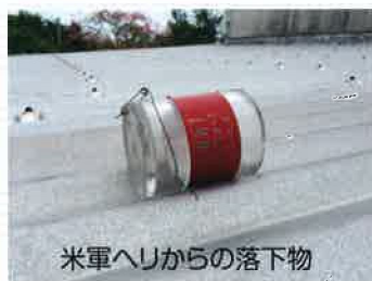
米軍ヘリからの落下物

2017年12月17日、我が子の通う保育園の屋根に米軍ヘリ部品落下物事故が起きました。