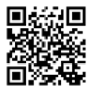
東京都産業労働局