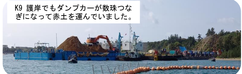
K9 護岸でもダンプカーが数珠つなぎになって赤土を運んでいました。