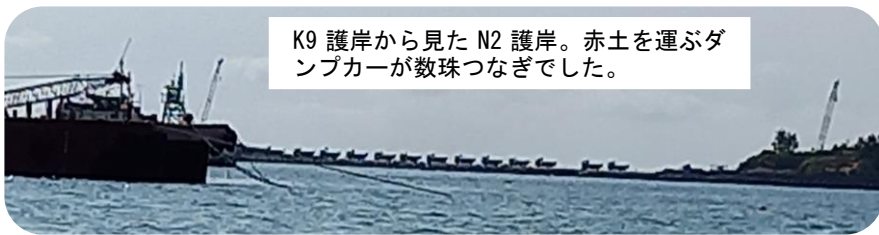
K9 護岸から見た N2 護岸。赤土を運ぶダンプカーが数珠つなぎでした。

K8 護岸付近でカヌーチームはフロート内に入り、「違法工事は中止せよ」「サンゴを殺すな」と抗議行動を展開しました。