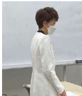
鎌田さゆり衆議院議員