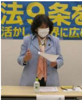
阿部知子衆議院議員