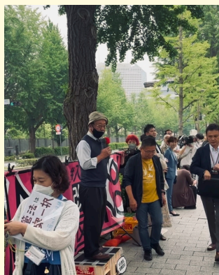
強行採決がなされた 2023年6月9日国会 前で抗議する市民

生活費・医療費・ 子どもの就学費・ 弁護士費用などに、 一人3万円ずつ支援 します。