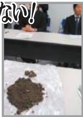
2017年2月防衛省への申入れでは、岩ズリ(土砂)の洗浄は出来ないことを突き付けた

昨年12月、国が代執行で承認した変更承認申請書では「石材は沖繩県内で確保できる」と記載されており、防衛局は県の質問に対しても「石材については、現時点で県外からの調達は考えていない」と回答していました。しかし最近になって「石材調達」を言い始めました。その場合防衛局は、土砂条例の手続き前に必要な変更について沖繩県知事の承認を得なければなりません、その申請を行っていません。